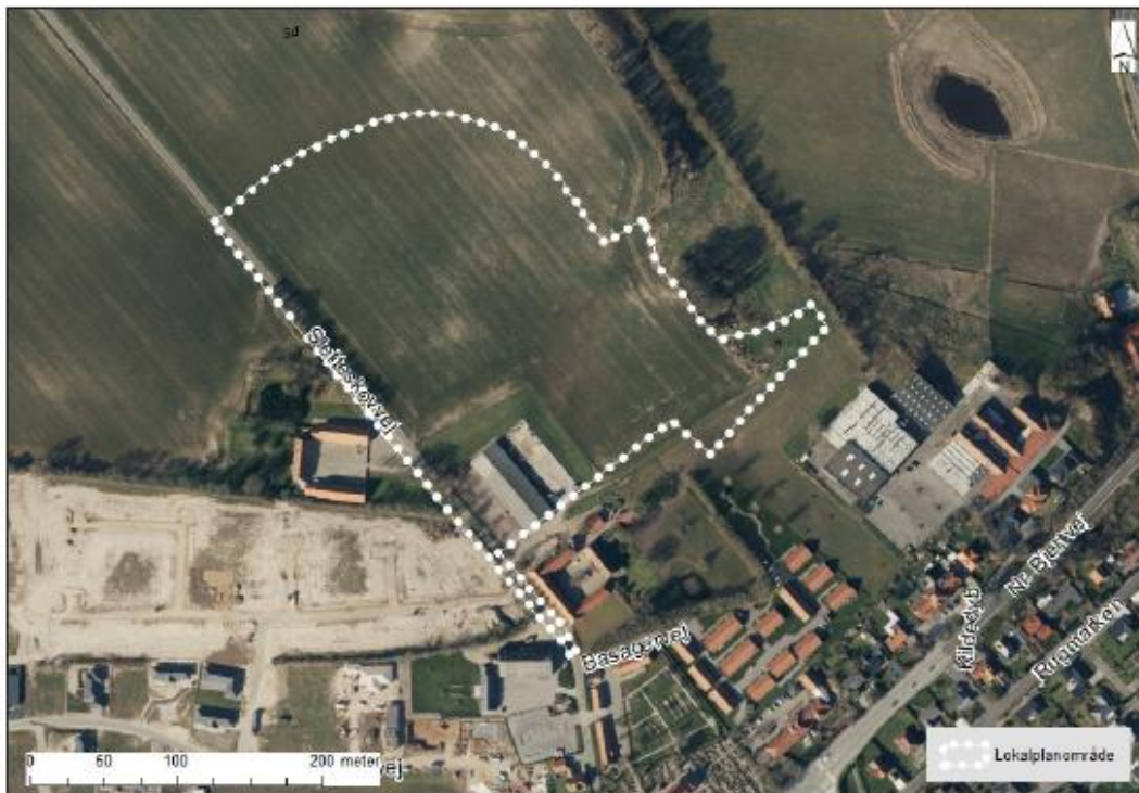
Luftfoto med planområdets afgrænsning.

Planområdet vejbetjenes fra Nr. Bjertvej via Sletteskovvej. Realisering af lokalplanen forudsætter, at Sletteskovvej udbygges. Når en ny påtænkt omfartsvej om Nr. Bjert er etableret, vil planområdet blive vejbetjent af denne via Sletteskovvej, dvs. fra nord.